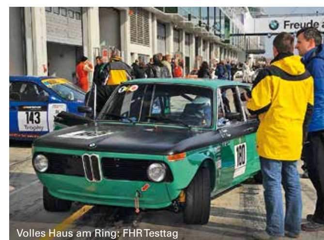
Volles Haus am Ring: FHR Testtag

Am 20. März findet auf dem Grand-Prix-Kurs des Nürburgrings der FHR-Test- und Einstelltag 2016 statt. Zugelassen sind historische GT, Touren- und Rennsportwagen mit einem gültigen Wagenpass oder Straßenzulassung (keine 06er-Kennzeichen). Die Fahrer müssen das 18. Lebensjahr vollendet haben und im Besitz eines Führerscheins oder einer Rennlizenz sein. Ein Helm ist obligatorisch. Anmeldeformulare gibt es auf der Homepage der FHR ( fhr-online.de ), der Youngtimer Trophy oder der FHR-Rennserien.