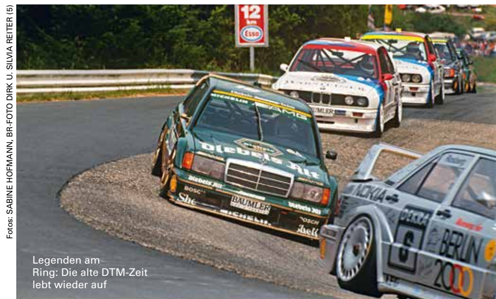
Legenden am Ring: Die alte DTM-Zeit lebt wieder auf

Die Nürburgring Legends ist auch ein Lauf der in diesem Jahr neu ausgeschrieben Rennserie Deutsche Tourenwagen Classics. Teilnahmeberechtigt an dem Rennen sind Rennwagen der Gruppe A (DTM) und N (DTC) der Baujahre 1984 bis 1994 sowie der Klasse 2 (STW) der Baujahre 1994 bis 1999. Gefahren wird nach dem DMSB-Reglement CTC und Gruppe H. Mehr Informationen zum Rennen erhalten Sie über die FHR-Geschäftsstelle: Kai v. Schaurath, (+49) 61 72/285 91-18 oder schaurath@fhr-online.de. Informationen über die Rennserie im Internet unter: www.tourenwagen-classics.de