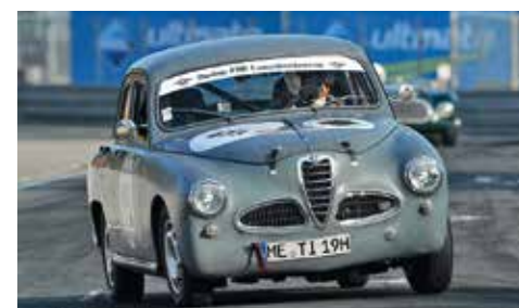
Tourenwagen willkommen: AGDT