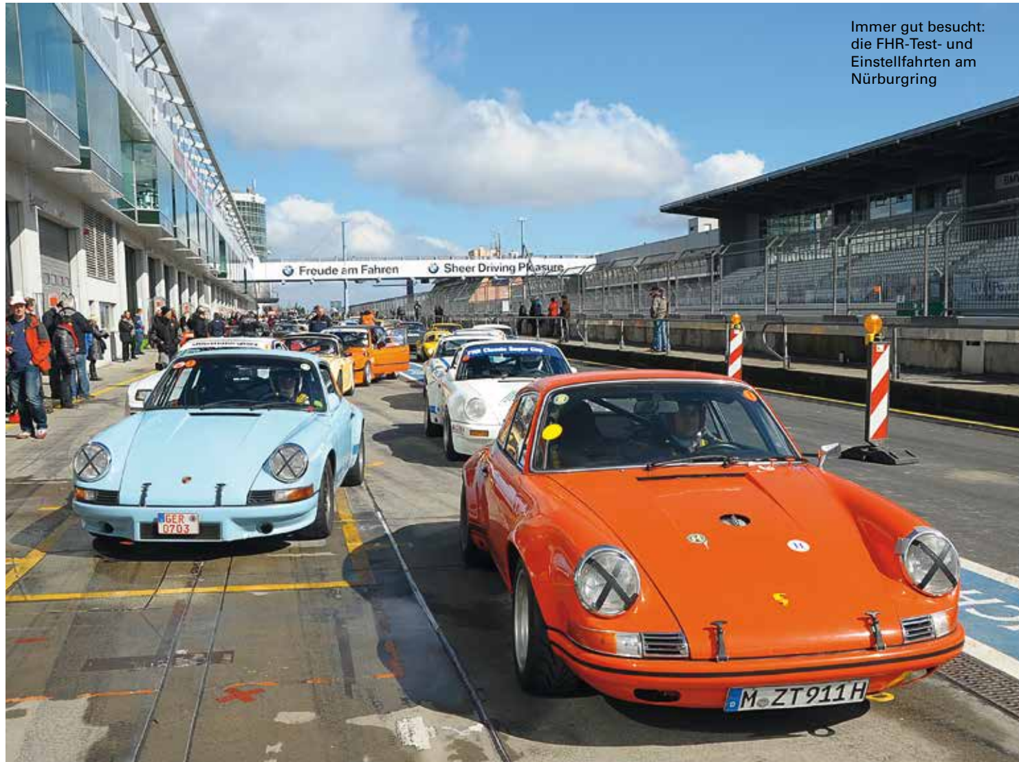
Immer gut besucht: die FHR-Test- und Einstellfahrten am Nürburgring